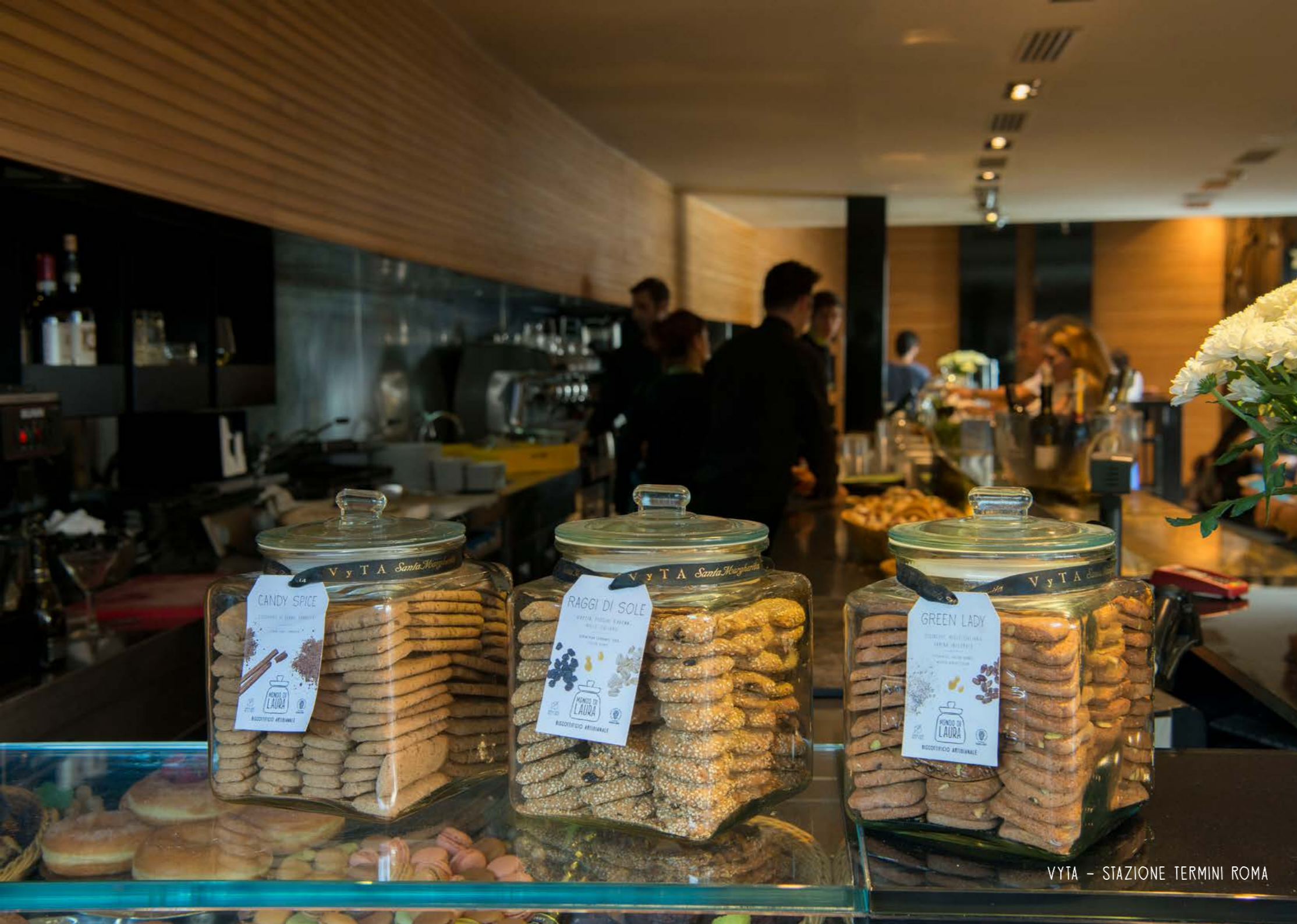
VYTA - STAZIONE TERMINI ROMA