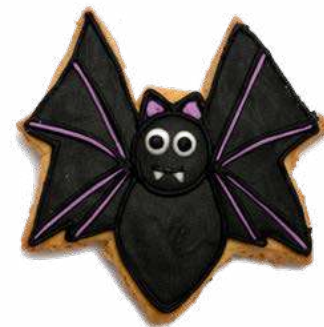
Pippy EAN 8057741391180