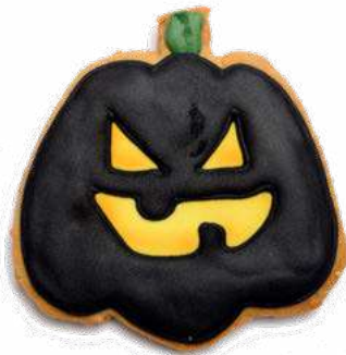
Paura EAN 8057741391203