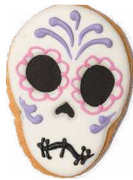
Skull EAN 8057741391234