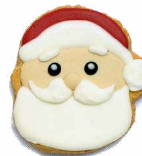
Nick EAN 8057741390138