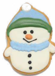
Snow EAN 8057741390817