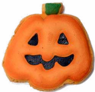
ZuccheRino EAN 8057741390534

BASE DI BISCOTTO ALLA VANIGLIA . VANILLA BISCUIT BASE . BASE DE BISCUIT À LA VANILLE 60 GR 10,5 X 9 CM