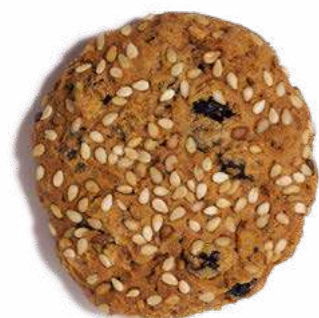
RAGGI DI SOLE

DISPONIBILE SOLO NEI MESI INVERNALI DISPONIBLE UNIQUEMENT EN HIVER