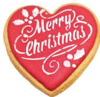
Love EAN 8057741390480

BASE DI BISCOTTO ALLA VANIGLIA . VANILLA BISCUIT BASE . BASE DE BISCUIT À LA VANILLE 60 GR 10,5 X 9 CM