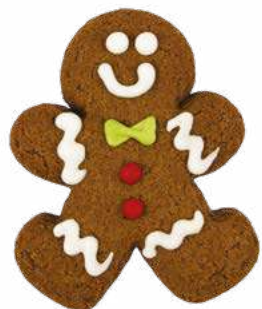
Jinger EAN 8057741390572

BASE DI BISCOTTO ALLE SPEZIE . SPICES BISCUIT BASE . BASE DE BISCUITS AUX ÉPICES 60 GR 10,5 X 9 CM